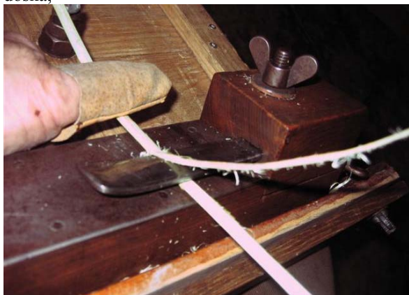
Obr.č. 9 Košíkársky hoblík od J. Adamčika

-hobl'ovanie ručným hoblíkom: Je to nôž z kvalitnej ocele prichytený v regulovateľnej odpruženej konzole a okovanou plochou. Hoblík si prichytíte na šikmú podložku (môže byť i naopak otočená košíkárská doska,