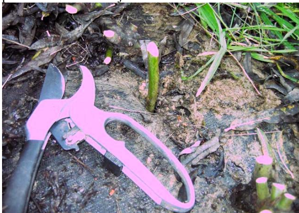
Obr.č. 6 Medzi dvoma sadenicami som našiel pri zbere suchú, ktorú som čo najnižšie odstrihol a na jej miesto som ihneď zasunul novú sadenicu, ktorá trčí asi 10 cm

Motorové plotostrihy a krovinorezy výrazne uľahčia prácu a skrátiť zber aj desaťnásobne.