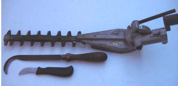
Obr.č. 5 Plotostrih, zberací nôž v Morkoviciach nazývaný „šnicar“ a zahnutý nôž- žabka

d) náradie . Zberací košíkársky nôž je asi 30 cm dlhý zahnutý s drevenou rúčkou, šetrí zberačovi chrbát – zber sa robí v predklone,