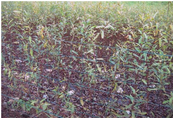
Obr.č.3 Americana vysadená v tomto roku má drevo ešte nevyzreté a miazga prúdi v rastline, čo je vidieť len na asi 40%-tnom zhode listov.

Vtedy je vhodné začať so zberom. Ak by bol prútnik zapadnutý snehom, musíte ho odhrabať. Lebo by vám zostali príliš vysoké hlávky. Odporúčam zber ak je zem zamrznutá a bez snehu.