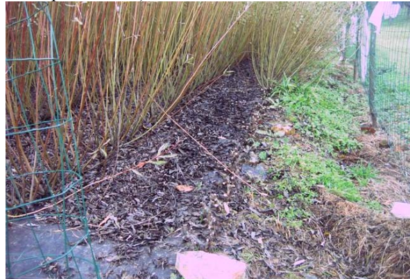
Obr.č. 7 Časť riadku s vystrihanými prútmi. Pníky sú kolmé a asi 1 cm dlhé a hlavne nie sú pozdĺžne prasknuté.

V ďalších rokoch pri zbere nožom môžete celý krík uchopiť mierne k sebe nahnúť, a čo najnižšie rezať kolmo na prút (rezná plocha bude menšia ako keby ste rezali príliš šikmo).