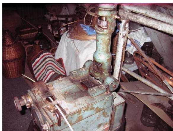
Obr.č. 12 Otvorená pracovná časť. V hornej je hnacie ozubené koleso, ktoré tlačí do dužiny. A v dolnej je prevod od motora. Vedľa lubka vidíte sklopenú odpruženú záklapku, ktorá zaručuje vhodnosť prítlaku pracovného ramena.

Hrúbkou si určíte použitie, tenké lubky do 0,3 mm na výplet demizónov, hrubšie na výplet stien košíkov, slepačích košov a pod.