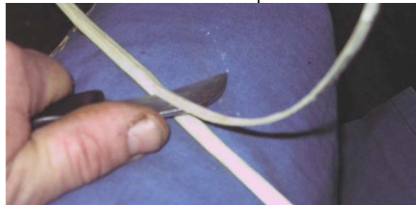
Obr.č.8 Zrezávanie dužiny a vnútornej vrstvy dreva nožom, ktorý musí byť pevne uchytený a nesmie meniť uhol rezu. Štiepku treba ťahať proti nožu.

-hobl'ovanie nožom: Na nohu si pripievate kúsok kože, alebo pevnej látky, položte prút drevenou časťou dolu a priložte nôž. Ťahajte prút proti nožu, aby ste dosiahli požadovanú hrúbku lubka a neprerezali ho, chce to zručnosť a viacnásobné opakovanie.