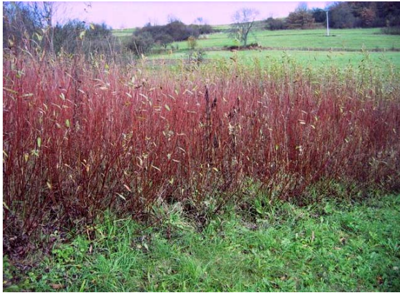
Obr.č. 2 Americana z roku 2000 má drevo vyzreté a miazga je skoro stiahnutá v koreni, listy skoro všetky listy opadané.