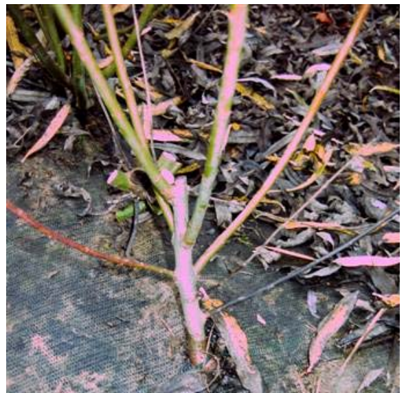
Obr. č.4 V tomto roku dosadená sadenica, ponechaná na vyššom pníku, pri zbere prútov ju treba zastrihnúť do výšky ostatných sadeníc

Prút strihajte v tej polohe ako stojí, ak by ste ho príliš zohli na vonkajšej strane nastáva pnutie a pri rezaní alebo strihu sa pník môže pozdĺžne puknúť. Rana spôsobuje vysychanie a väčšiu možnosť napadnutia chorobami. Stáva sa, že prasknutá časť v nasledujúcom roku vysychá, nové prúty začnú vyrastať mimo nej. Na jar dosádzané sadenice zrežte vo výške susediacich sadeníc, aby nebola príliš vysoká rodiaca hlávka – babka.