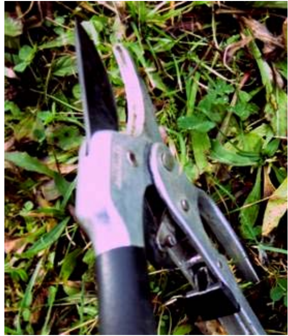
Obr.č.3 Kovadlinkové nožnice

Pozn: Pri zbere nožnicami, alebo nožom Vás po čase začne bolieť chrbát z hlbokého predklonu. Osvedčili sa mi nákolenníky, ktoré Vám umožnia zber s rovným chrbátom. Pri zbere v prvom roku ak mala vrba dobre podmienky, v prvej tretine, alebo i vyššie urobila vetvy značne trčiace do strán. Ak by ste takéto prúty viazali do snopu, dajú sa dosť ťažko utiahnuť, preto si hneď tieto veľké vetvy pri zbere odstrihnite.