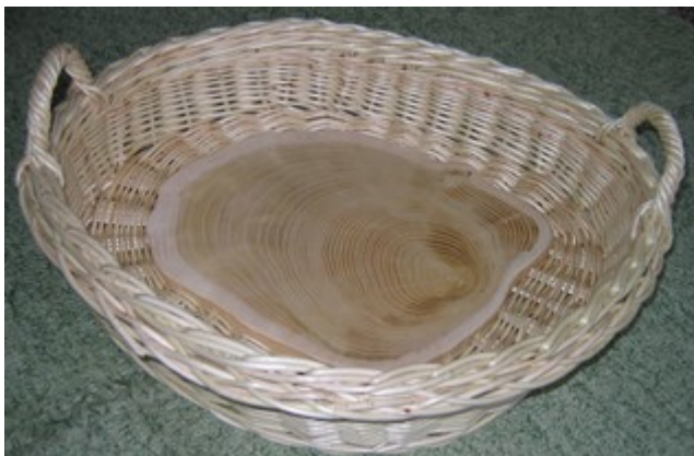
Obr. 2. Diery som vrtal do hornej polovice hrúbky, aby výplet bol s plátom v rovine a spodná časť bola zas v úrovni spodnej nohy. Tak „sedel“ košík po celej svojej ploche.

plát. Uhlovou brúskou som ho vyhladil z oboch strán. Do kôrovej časti som 6 mm vrtákom spravil asi 6 cm hlboké diery, vzdialené asi 4 cm. Kolíky som mierne kónicky zastrúhal a zatĺkol do plátu. Vyplietol som asi 5 cm výplet, do ktorého som podľa potreby vsúval jeden, alebo dva stojáky.