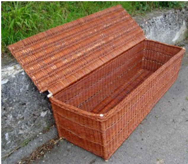
Obr. 13 Veko je nasunuté do drevoskrutiek s očkom.

Začiatkom mája sa mi v telefóne ozvala polo zúfalá pani z Polianky. Hneď začala, či by som jej vedel spraviť veľký hranatý kôš, že už ju viacerí košíkári odmietli. Dohodli sme si stretnutie a povedali si podrobnosti. V 6/II čísle Koš (nov) ín na strane 6b som zverejnil polotovár a v tomto čísle už i hotovú truhlicu.