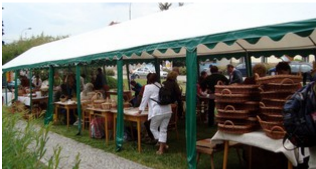
Obr. 16 Košíkárske podujatie je v termíne Morkovických hodov, pohostenie a bohatý program pokračuje tanečnou zábavou v amfiteátri.