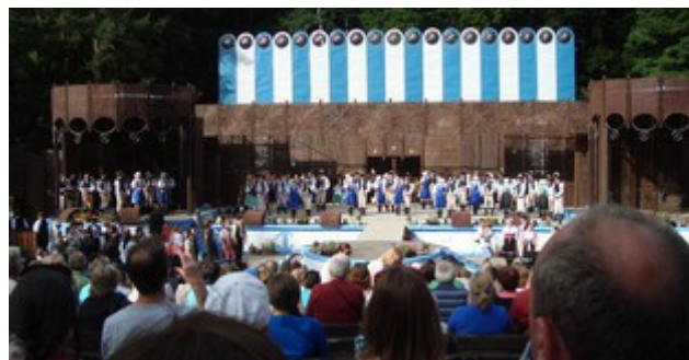
Obr. 15 Celé javisko pôsobí ako veľká teplá otvorená náruč. Obrázok je z vystúpenia súboru Kopaničiar a Kopa v tradičných modrých krojoch.