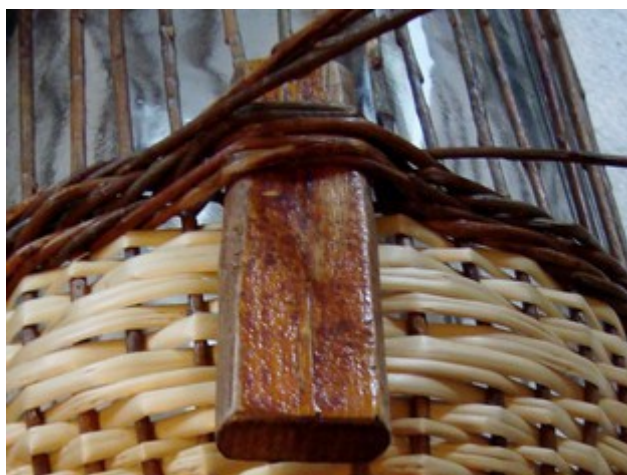
Obr. 8 Opasok má širší nábeh z oboch strán, ale vymedzovací kolík tak vytvorí pohodlnú medzeru pre úchyt ucha.

Ľavý prút rýmovky povediem až cez 4 za 1 (prvý stoják vpravo od kolíka).