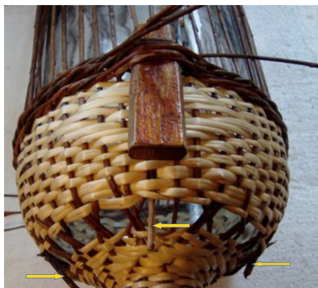
Obr. 4 Jeden kolíček som si olúpal z kôry a budem ho používať ako orientačný pre začiatok vzoru. Je posunutý doľava o jeden stoják od neskríženého stojáka. Preto, lebo počet stojákov je nepárny.

Ako prvý som označil stoják, ktorý leží presne oproti uchu a od neho som odpočítal 12 stojákov smerom doľava a 12 stojákov smerom doprava. Obidva som označil kolíčkom a posledný som odpočítal od jedného z nich tiež ako 12-ty, pri uchu (pri opasku z rýmoviek, kde je vymedzovací kolík)