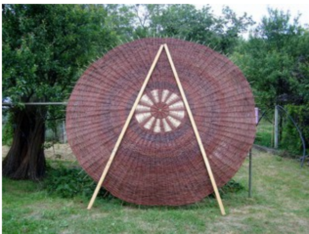
Obr. 10 Po dohode mal kruh napokon „len“ 3,5 m. Po vypletení asi 40 cm kruhu som pri párovaní zmenil v jednej ceste miazgované biele prúty. Striedanie farieb vytvorilo lúče.

Celý kruh som na okraji zalemoval dvojpárovou lemoukou. Spotreboval som asi 65 kg prútov. Kruh sme začistili, odrezkov bolo skoro dve vedrá, vystužili latami a postavili sušiť.