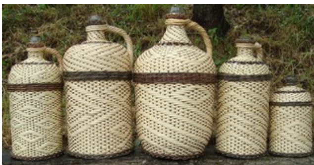
Obr. 3 (zľava)

Na väčších flašiach je možnosť tvorby vzoru rozmanitejšia a môžem si dovoliť viacero kombinácií liniek a geometrických tvarov.