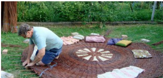
Obr. 9 Pri zväčšovaní priemeru som pridával kolíky až na konečných 76 kusov.

Ešte v roku 1994 som si požičal v Univerzitnej knižnici v Bratislave jednu nemeckú knihu, kde bola fotografia ako pletol košíkár veľký kruh z ľubov. Mal ho položený na zemi, kľučal v strede a dookola pletol. Tak som to položil na zem pod okraj výpletu som dal tehličky, aby kolíky boli mierne zdvihnuté od zeme. Kruh som vyložil poduškami a dekami, položil som si tam náradie a prúty. Ako som tlačil kolenami do kolíkov, kruh sa pekne vyrovnával.