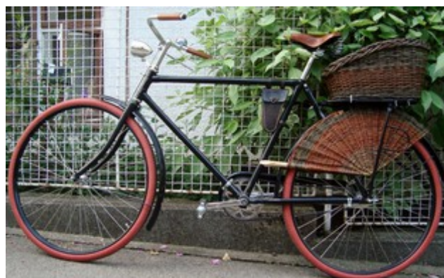
Obr. 12 Košík mal elipsovité dno, výšku koša som robil plátňovým výpletom s nadkladaním prútov spodok-spodok, špička-špička s postupným posúvaním otáčania okolo stojákov. Okraj krytu je z armovacieho železa priemeru 6 mm. Na konce som nasunul prevrätané smerkové tyčky, ktoré som spojil drevoskrutkou.

Zákazka patriaca tiež do tých špeciálnych. Pán z Bratislavy si krásne zrekonštruoval starý bicykel. Dohodli sme si stretnutie, nechal mi doma bicykel a presne na mieru som mu vyrábala košík na nosič a kryt na zadné koleso.