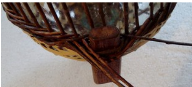
Obr. 7 Prúty rýmovky, ktoré prechádzajú okolo vymedzovacieho kolíka zalamujem nechtom aby čo najmenej odtlačali stojáky do strán. Stojáky za kolíkom zasa trochu roztahujem, lebo rýmovka má snahu priblížiť ich k sebe.

Ľavý prút rýmovky povediem až cez 4 za 1 (prvý stoják vpravo od kolíka).