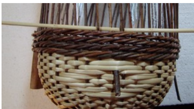
Obr. 5 Chcem aby vzor, ktorý bol vytvorený nad opaskom bol symetrický s vzorom i pod opaskom.

Pletiem smerom doprava. Demižón si otočím nahor prvým kolíčkom, ktorý je vpravo od ucha. Podvlečiem ponad neho lubok tak, aby ľavý koniec lubka bol po ucho a týmto smerom ho cestou cez 1 za 1 zapletiem.