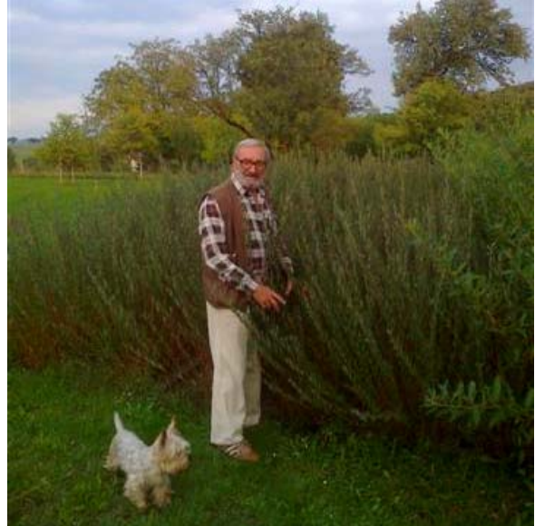
Obr.5 Uralka má už vrchol vzrastu, krásna hustá asi 160 cm.