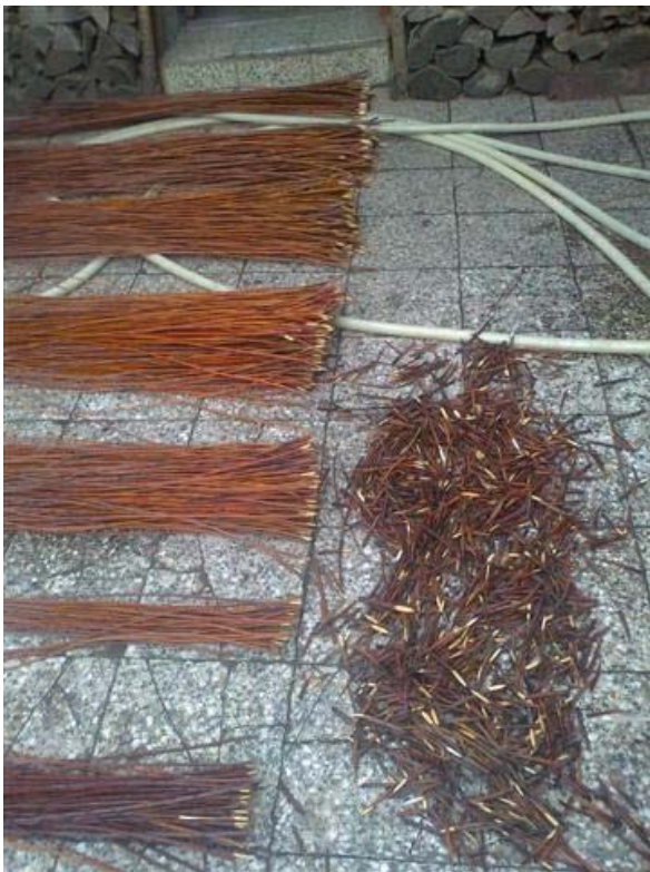
Obr. 18 Roztriedené a zarezané prúty , kde si podľa ich dĺžky volíte aký budete robiť kôš. Hromadou zbytkov určená na spálenie.

Pretože som doposiaľ nedostal od Vás príspevky, obsahová stránka Koš (nov) ín bude vždy vychádzať tematicky z mojej práve vykonávanej košíkárskej práce. Bude to podľa obdobia aktuálne a budem sa snažiť zapracovať i ostatné kapitoly ako boli uvedené v Koš (nov) ínách č.3 str.1a.