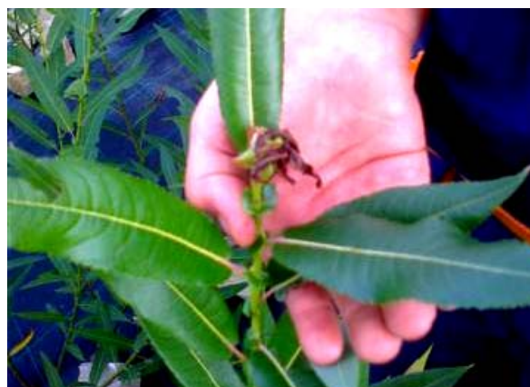
Obr.4 Suchý vrchol prúta „amerikany“

Výskyt škodcov je oproti jarnému obdobiu oveľa menší. Po Mandelinke vŕbovej, ktorej húsenice spôsobujú menší ohryz listov je občasný výskyt napichnutia vrcholkov Zubonoskou. V poraste som našiel viackrát bažantov, ktorí zberom hmyzu v prútniku pomáhajú.