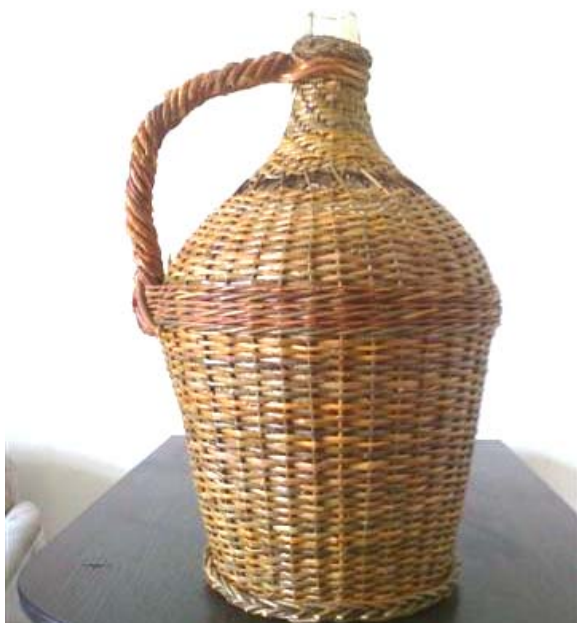
Obr.7 15-litrový demižón s 39 osnovami, ktoré boli v 13 skupinách po troch prútoch. Plátňový výplet je hustý a dobre prilieha ku sklu.

Opletené demižóny sú žiadaným tovarom a zachovanie technológie opletania „do prútov“ si nájde vždy svojich vyznavačov. Krásne opletené demižón je ozdobou stola na každej hostine, istotou pri manipulácii s kvalitným obsahom a v neposlednej miere i krásnou reklamou poctivého košíkára.