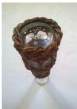
Obr.15 Osnovy pri lemovaní prisne držte pri skle, lemovka musí „sedieť“ na spodku pohárika.

S dvoma pomocnými prútmí spravte dvojpárovú lemovku „za 1 cez 1 za 1“ a začistite.