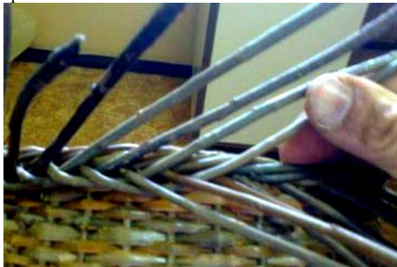
Obr. 10 Trčiacie prúty z 4-párovej lemovky podkladám „popod 2 nad 1“. Pod prvé dva si dajte kôličky, ktoré vám vytvoria miesto pre prevlečenie posledných prútov.

Potom z demižóna vylejem vodu a pletiem na kolenách. Po priložení dna robím 4-párovú závierku „za 2, cez 3, za 1“ a pri dostatočnej dĺžke osnovy pripletiem na boku prídavnú lemovku „pod 2 nad 1“, ktorá významne chráni pred bočným nárazom na spodok demižóna.