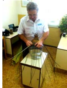
Obr.9 Je dobré ak máte výškovo polohovateľný stolík na rôzne veľkosti demižónov.

Pri ďalšom pletení priezoru (okienok) sa mi veľmi osvedčilo pletenie pliec po stojacky, ktorým pokračujem až do úrovne pliec.