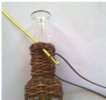
Obr.16 Ak by ste si nedali pod hornú lemovku kuličku, tak pri neopatrnom prevliekaní šnúrky by sa vám mohla lemovka rozplieť.

V medzere po kuličku za pomoci háčku prevlečte napr. koženú šnúрку.