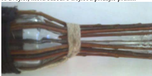
Obr.8 Tretí prútiček presahuje cez bielu šnúřku

K dvojici, ktorá susedí s trojicou pridajte prútiček.