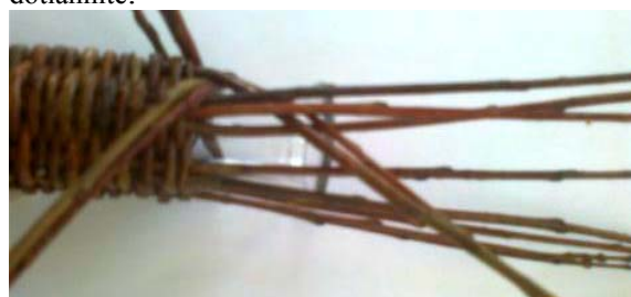
Obr.11 Vytvorenie druhej trojice vám umožní robiť pravidelnú závierku dvojicami, lebo máte párny počet osnov.

Pod jednu dvojicu dajte količek a zakladajte „za 1“, trojicu rozdeľte na dvojice (budete mať 8 dvojíc), poslednú dvojicu podvlečte a všetky dvojice poriadne dotiahnite.