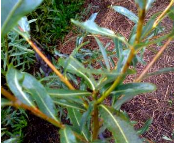
Obr.3 Ohryz vrcholov bol častejší na Lineárke ako na Amerikane

Na „lineárke“ vo výške 150 cm Zubonoska napichla vrchol a prút vyhnal náhradné vrcholy.