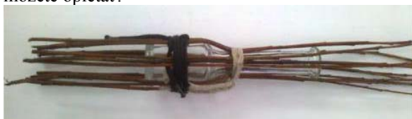
Obr.7 Na vrchu je trojica prútov

15 prútikov dlhých aspoň 30 cm rozdeľte do skupín po dva a v jednej po tri prúty, zviažte šnúrkou tesne pri dolnej časti hrdla (7 skupín – nepárny počet). Druhou šnúrkou previažte i cez širšiu časť. Prútičky vám nebudú trčať do strán a pohodlne položenú na nohe môžete oplietať.