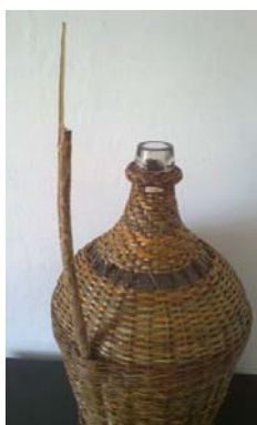
Obr. 11 Kostru ucha zarežete dlhým šikmým (aj 15 cm dlhým) rezom a pred vsunutím zmáčajte lubky v mieste vpichov. Primerajte pri hrdle a zastrihnite. Hornú časť opatrne zrežte do tenkého lubka.

Kostru ucha po vsunutí do výpletu cez štrbinu opasku (súbor trojprútových rýmoviek „cez 2 za 1“) na druhom konci zrežem do lubka, ktorý podvlečiem pod skupinu osnov, kde som ihneď po troch okruhoch podvlekol kôliček a ten mi vytvoril miesto na zasunutie konca zrezaného do lubka.