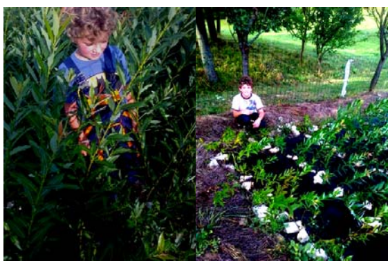
Obr.2(ľavý) prút „amerikany“ s hustým vetvením, výška porastu 140 cm,

Salix americana sadená v tomto roku výrazne zahustila porast vetvením, čo je dôkazom o dobrých podmienkach. Sadence v blízkosti ovocných stromov i keď majú dostatok svetla sú výrazne menšie a niektoré vyschli. Domnievam sa, že stromy svojimi hlbokými koreňmi odčerpávajú vlahu a živiny.