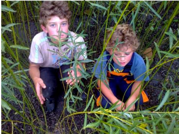
Obr.2 Na zemi je asi 30% opadaného prútia

Prúty majú už značne opadané spodné prúty a po prvých mrazíkoch miazga zide do koreňa, rastliny aby zabránili odparovaniu vody, začnú spontánne zhadzovať listy.