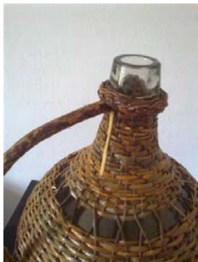
Obr. 12 Lubok prestrčte popod skupinu osnov až tak, že je kostrový prút opretý o výplet a je pod lemovkou hrdla.

Lubok pritlačte ku kostre a húžvou omotávať. Ucho je potom oveľa stabilnejšie. Keď som predtým kostrový prút iba priložil pod lemovku hrdla, stávalo sa mi, že po vysušení výpletu a húžvy sa omotka trochu uvoľnila a ucho sa mierne pohybovalo do boku.