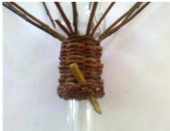
Obr. 12 Ak by ste pletli až po okraj šikmej časti, museli by ste osnovy silne priláčať na sklo. Takto vám výplet dobre prilahne a hneď môžete pliesť šikmú časť.

Po založení druhý krát opäť dvojice dotiahnite. Po treťom založení vpichnete pod lemovky šídlo, ktoré spraví miesto pre količek. Lemovku opäť poriadne dotiahnite a až potom ostrihajte trčiacie prútičky. Teraz dajte dolu šnúřky a výplet stlačte po rozšírenú časť.