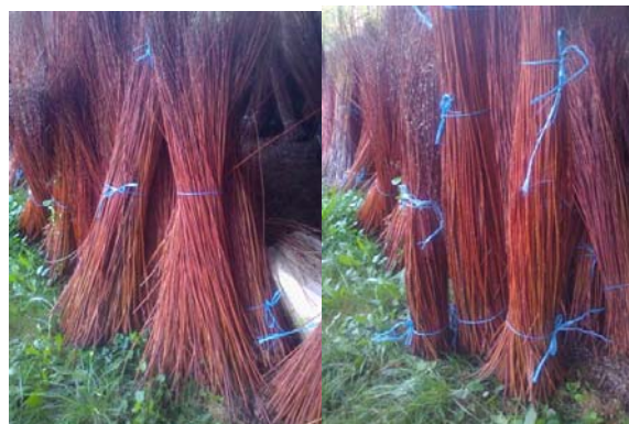
Obr.5 Prúty po vytriedení, zviazané povoleným motúzom v hornej polovici a spodky prútov roztiahnuté.

Úroda vlnajších prútov, ktoré po vytriedení a snopkovaní boli zviazané len jedným motúzom tak, že bol posunutý k vrcholu a spodky pre lepšie doschnutie boli roztiahnuté, pripravte na trvalé uskladnenie.