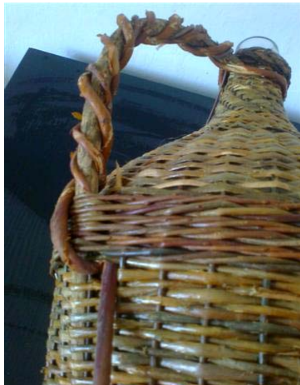
Obr. 13 Zastoknutý omotkový prút popod opasok a výplet zalomte a kvalitne zhúžvite, pred omotávaním kostry prút otáčaním napnite tak, aby sa pozdĺžne puklinky spojili. Pod hrdlom je koniec kostrového prúta, ktorý bol zrezaný na lubok pritlačený ku kostre a už omotaný húžvou.

Omotkové prúty zasúvam zospodu pod opasok a až pod výplet. Zalomením nahor je prút založený viac a významne zvyšuje nosnosť ucha. Pri zasúvaní zvrchu držala ľarchu demižóna len slučka prechádzajúca v medzere opasku.