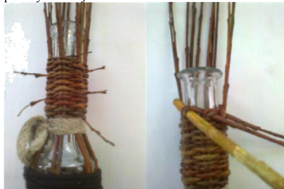
Obr.9 Pri opletaní tlačte osnovy na sklo, lebo horný rozšírený okraj ich trochu odtláča.

Výplet hrdla robím vysoký asi 4 cm. Trčiacie prútičky ostrihajte.