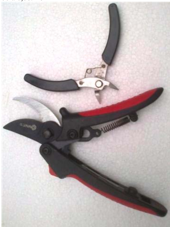
Obr.14 Rúčky sú na kliešťach NAREX pevne pritavené a nezvliekajú sa, dolu nožnice s mierne natiahnutou pružinou

Už všetci viete, že sa nám osvedčili elektrikárske klieštiky na začisťovanie prútov. Po rokoch používania rôznych typov, ktoré vydržali najviac rok, kúpil som vlni kliešte NAREX a som s nimi veľmi spokojný. Silné ramená s pevne nalisovanými rukoväťami, široké roztvorenie mierne zahnutých čepeľí umožňuje pohodlný strih i v neprístupných miestach. Oceľová pružinka má dostatočný odpor, rúčky tlačia do ruky silou, ktorá zabráni ich vypadnutiu z ruky pri akokoľvek nakláňaní. Malým nedostatkom je, že rezné hrany čepeľí nie sú po celej dĺžke, musím dbať pri strihaní na správne založenie klieští, alebo strih zopakovať. Cena bola 6,88.- €