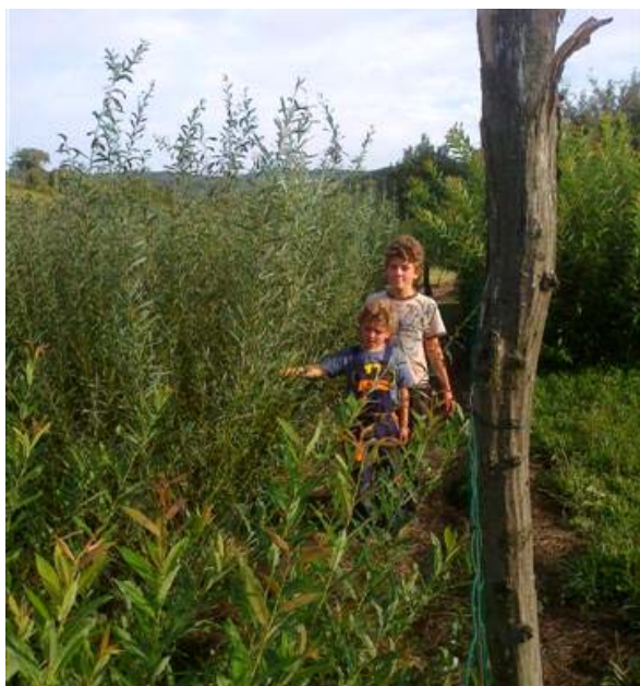
Obr.1 Vpredu „amerikana“, chlapci stoja pri „lineárke“

Salix purpurea var. linearis vysadená v roku 2011 dosiahla už koncom augusta vrchol svojho vzrastu, priemerná výška 2,6 m. Silné zahustenie porastu spôsobuje už od konca júna opadávanie spodných listov a odumretie slabších výhonkov. Priemerný počet plnohodnotných prútov je 8, čo je asi polovica z počtu na jar rašiacich výhonkov.