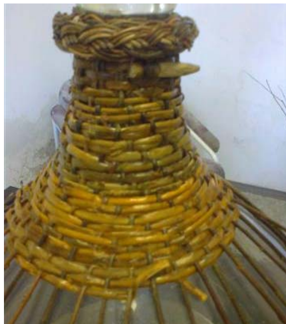
Obr.8 Lemovka pod hrdlom 5x preložená, pod jednou skupinou je vsunutý kolíček pre uchytenie kostry ucha, rozdelenie osnov „cez 3 za 1“ a v širšej časti „cez 1 za 1“, ukončenie lubka podvlečením v predošlom okruhu

Po prejdení asi do tretiny pliec demižóna prejdem do pletenia „cez 1 za 1“, ktoré vykonám aspoň 3x dookola a ukončím dopletením.