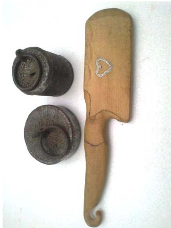
Obr. 15 Drevený tĺčik z bukového dreva na ubíjanie výpletu a dve olovené závažia pre košíky menších priemerov dna naliate v plechových konzervách