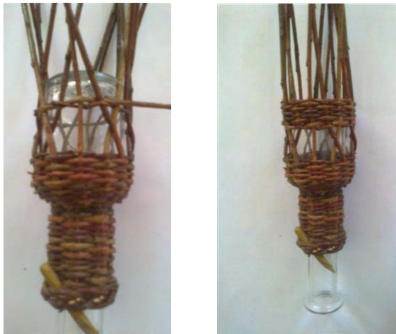
Obr.13 Po prejení dookola tenký koniec pritiahnite aby prilahol na sklo a 2-3x podpleťte

Odstrihnite koniec pridaného prútika. Zostane vám 15 prútikov (nepárny počet). Začnite tenkým koncom plette „cez 1 za 1“ až asi 1,5 cm širšej časti. V úrovni kuličky nechajte samotný (neskrížený) prút a začnite krížiť, plette až do úrovne spodku.