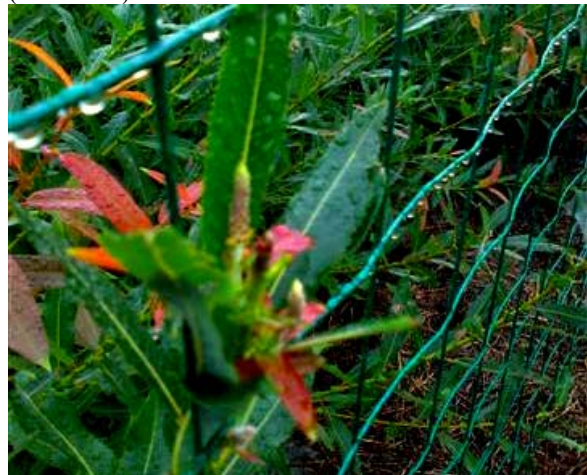
Obr. 1 Amerikana v krainom riadku ide za svetlom. robí...šable“