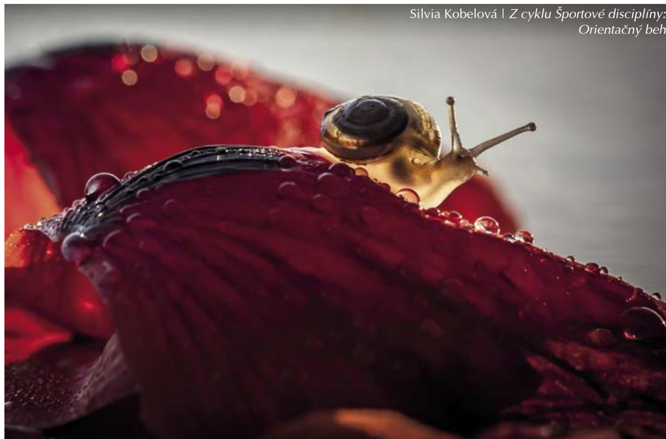
Silvia Kobelová | Z cyklu Športové disciplíny: Orientačný beh