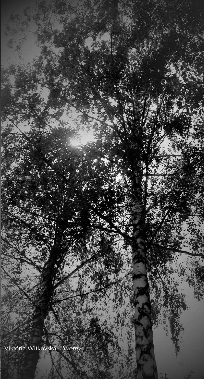
Viktória Witkovská | Stromy