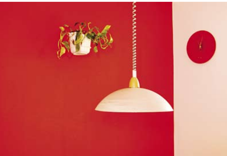
Fotografia na titulnej strane: Katarína Korcová | Pred obedom